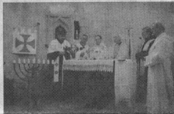
In der Templerkapelle in Wettin wurde im Jahr 2002 die erste katholische Messe nach 690 Jahren gefeiert.

Ein weiterer Programmpunkt am 25. April ist ein Gottesdienst in der Stiftskirche, während dessen eine Knappenaufnahme stattfindet. Die Stiftskirche, ebenfalls eine Gründung der Zisterzienserinnen, bot dazu den passenden historischen Rahmen. Auf dem Konzil von Troyes (1128) wurde unter Mitwirkung des heiligen Bernhard von Clairvaux, Gründer des Zisterzienser-Ordens, die Ordensregel der