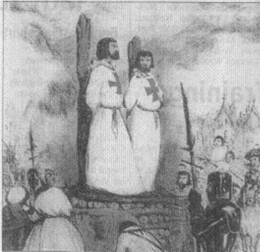
Zu Beginn des 14. Jahrhunderts wurde der Orden der Tempelritter aufgelöst, seine Mitglieder als Ketzer verbrannt.

Deutscher Orden hält am Wochenende Symposium ab - Vortrag morgen um 20 Uhr