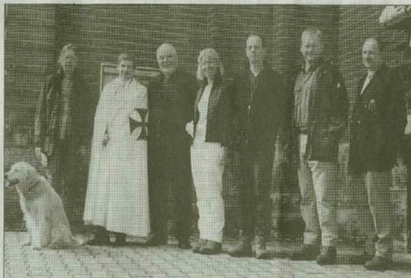
In der Kirchengemeinde St. Marien erhielten die Pilger am 26. September ihren Segen und wurden auf die lange Reise verabschiedet.

Während seiner langen Geschichte ist der Orden oftmals